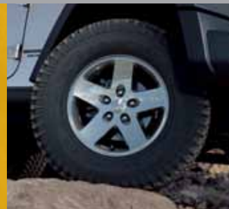
17-calowe, aluminiowe Moab, lakierowane, w kolorze Satin Carbon (standard w wersjach Rubicon i Unlimited Rubicon)