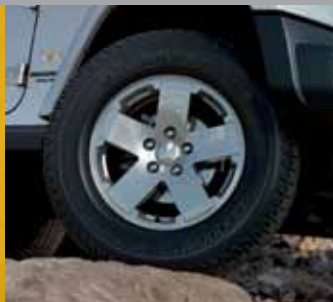
18-calowe, aluminiowe Gladiator, lakierowane, w kolorze Satin Silver (dostępne w wersjach Sahara i Unlimited Sahara)

(1) Żaden system, niezależnie od tego, jak zaawansowany, nie jest w stanie zmienić praw fizyki ani zapanować nad nierozważnymi zachowaniami kierowcy. Osiągi są uzależnione od aktualnej przyczepności, na którą może negatywnie wpływać obecność śniegu, lodu oraz innych czynników. Gdy miga kontrolka ostrzegawcza systemu ESC na tarczy prędkościomierza, kierowca powinien ostrożniej operować pedałem przyspieszenia oraz dostosować prędkość i sposób prowadzenia do aktualnych warunków drogowych. Należy zawsze prowadzić uważnie, w sposób adekwatny do aktualnych warunków. Należy zawsze mieć zapięte pasy bezpieczeństwa. (2) Dzieci w wieku 12 lat i młodsze powinny podróżować na tylnych siedzeniach, zapięte w pasy bezpieczeństwa. Niemowlęta umieszczone w fotelikach skierowanych tyłem do kierunku jazdy nie powinny być przewożone na przednim fotelu w samochodach wyposażonych w przednią poduszkę powietrzną pasażera. Wszyscy pasażerowie powinni mieć zawsze prawidłowo zapięte pasy bezpieczeństwa. (3) Telefon musi obsługiwać profil dostępu do książki telefonicznej (PBAP) Bluetooth.